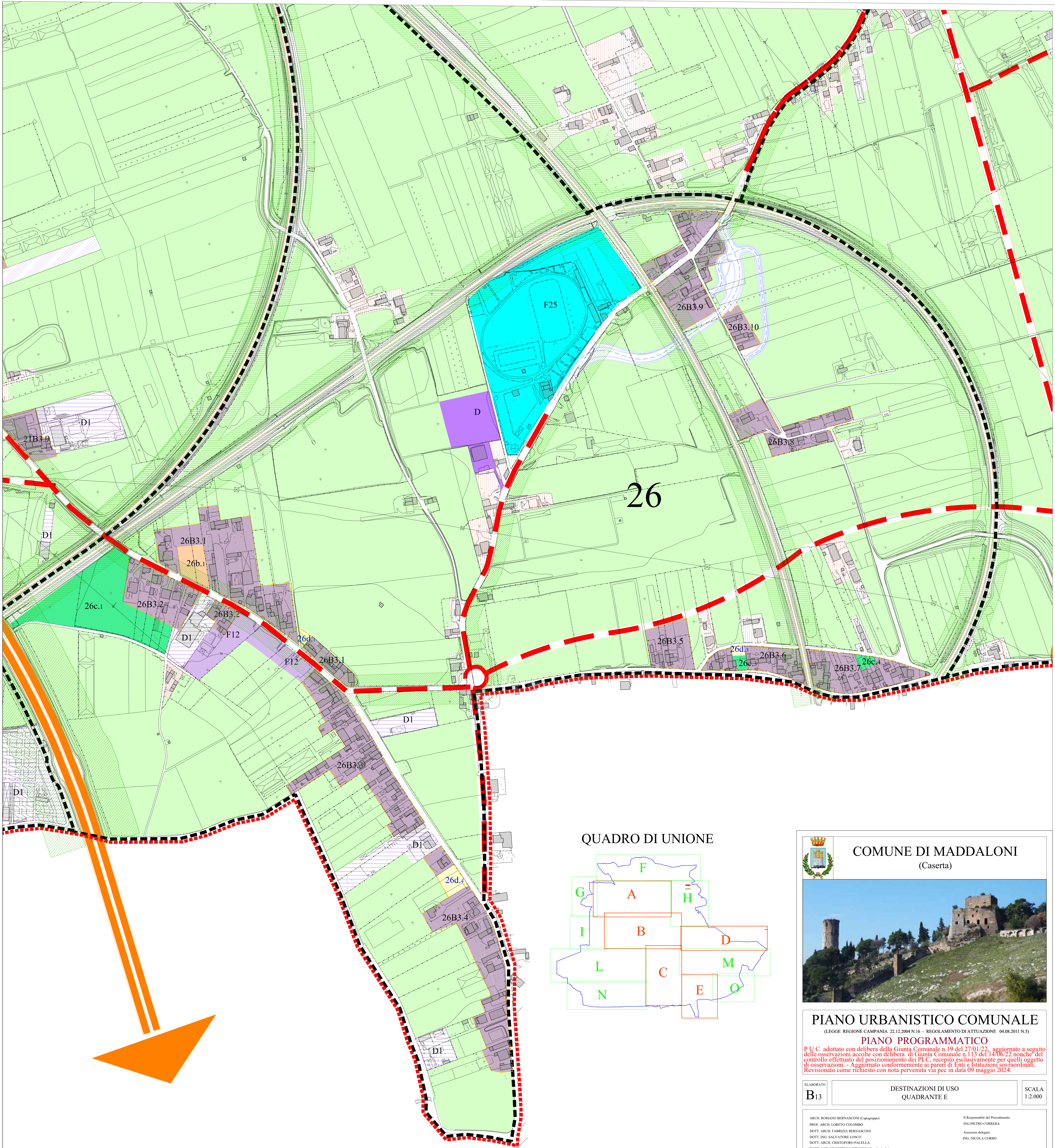
QUADRO DI UNIONE