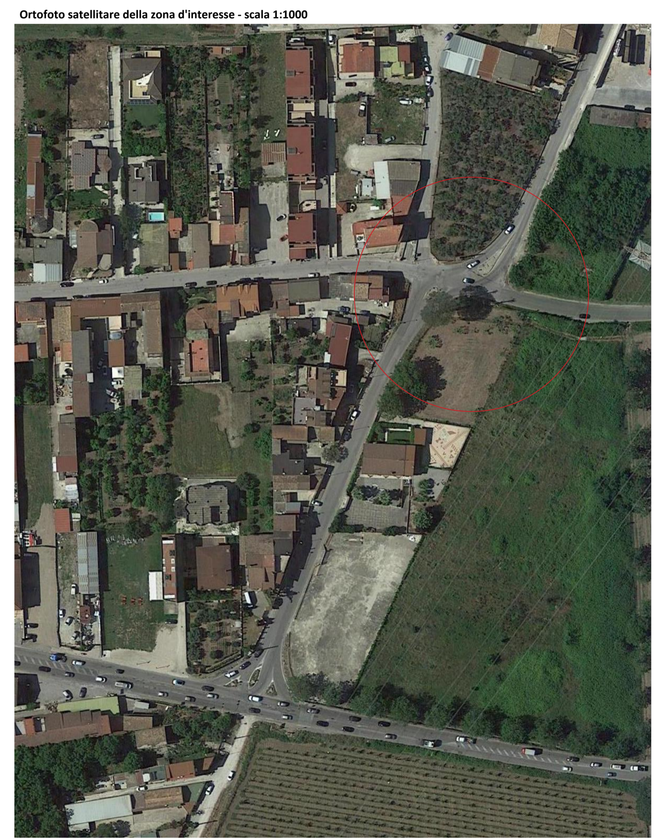
Ortofoto satellitare della zona d'interesse - scala 1:1000