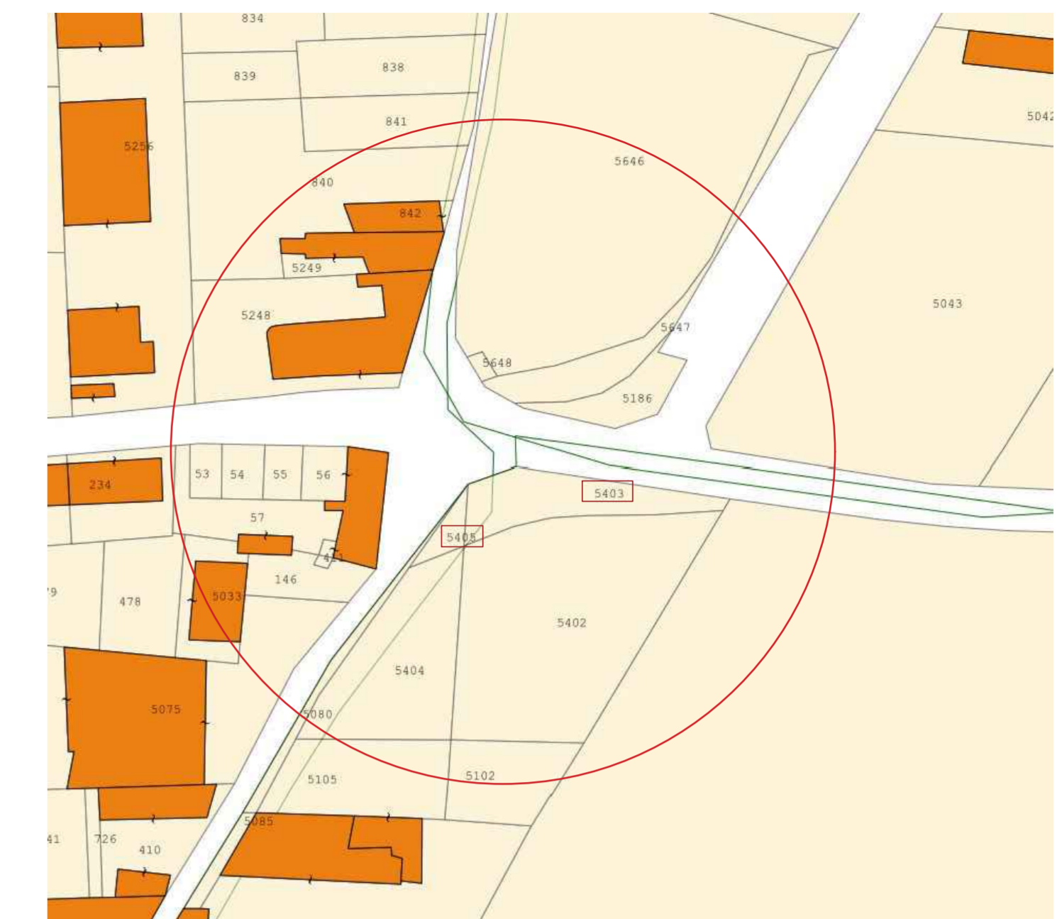
P.lle 5405 e 5043 censite al foglio 25 del Comune di Maddaloni Stralcio di mappa catastale della zona d' interesse - scala 1:1000